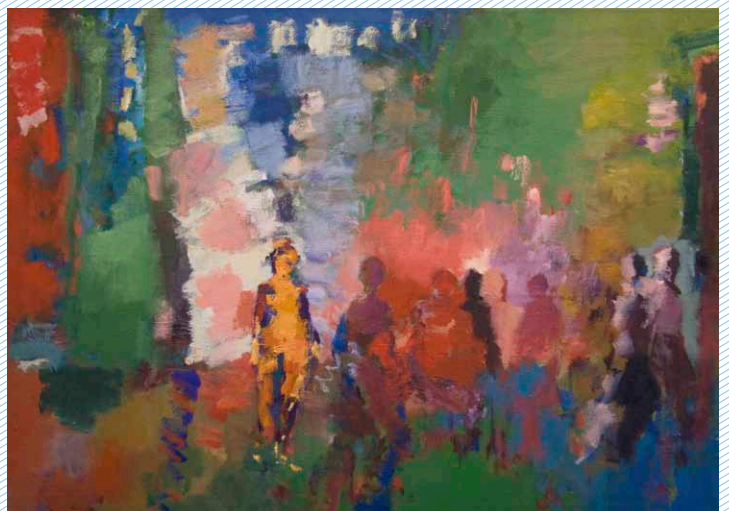
^ 'De ontmoeting' van Frank van der Pluijm.

Tot en met 11 november exposeert beeldend kunstenaar Frank van der Pluijm zijn werk in de Waerschut; gratis toegang.